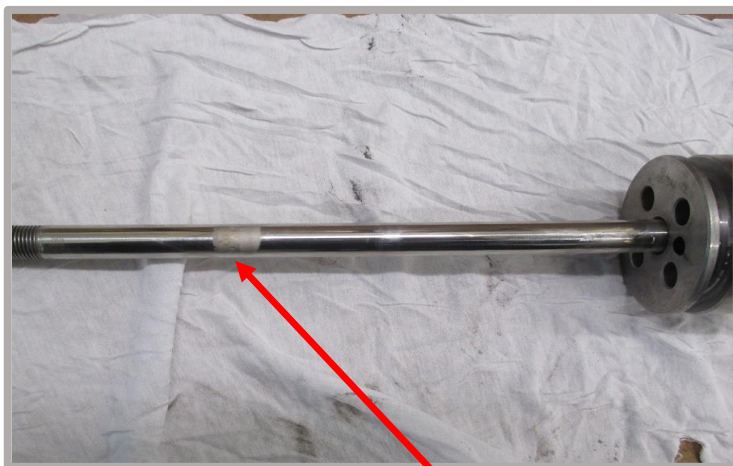
▲摺動金属部品の接触傷、 摩耗痕 が認められます