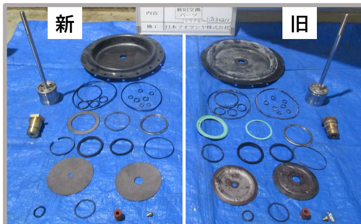
▲交換部品 ゴム部品の劣化が多く認められます